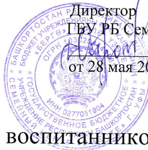
График питания воспитанников